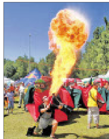
Ein buntes Programm erwartet die Besucher ab morgen beim „3. Salzburger Drachenbootcup & Festival“ in Bürmoos.