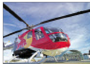
Die Flying Bulls präsentieren ihre „BO-105-Helikopter-Kunstflugshow“.