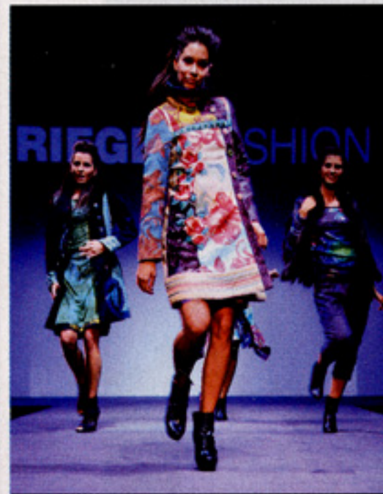
Dynamische Auftritte: Models am Laufsteg in Action bei der WOW FASHION SHOW im republic.