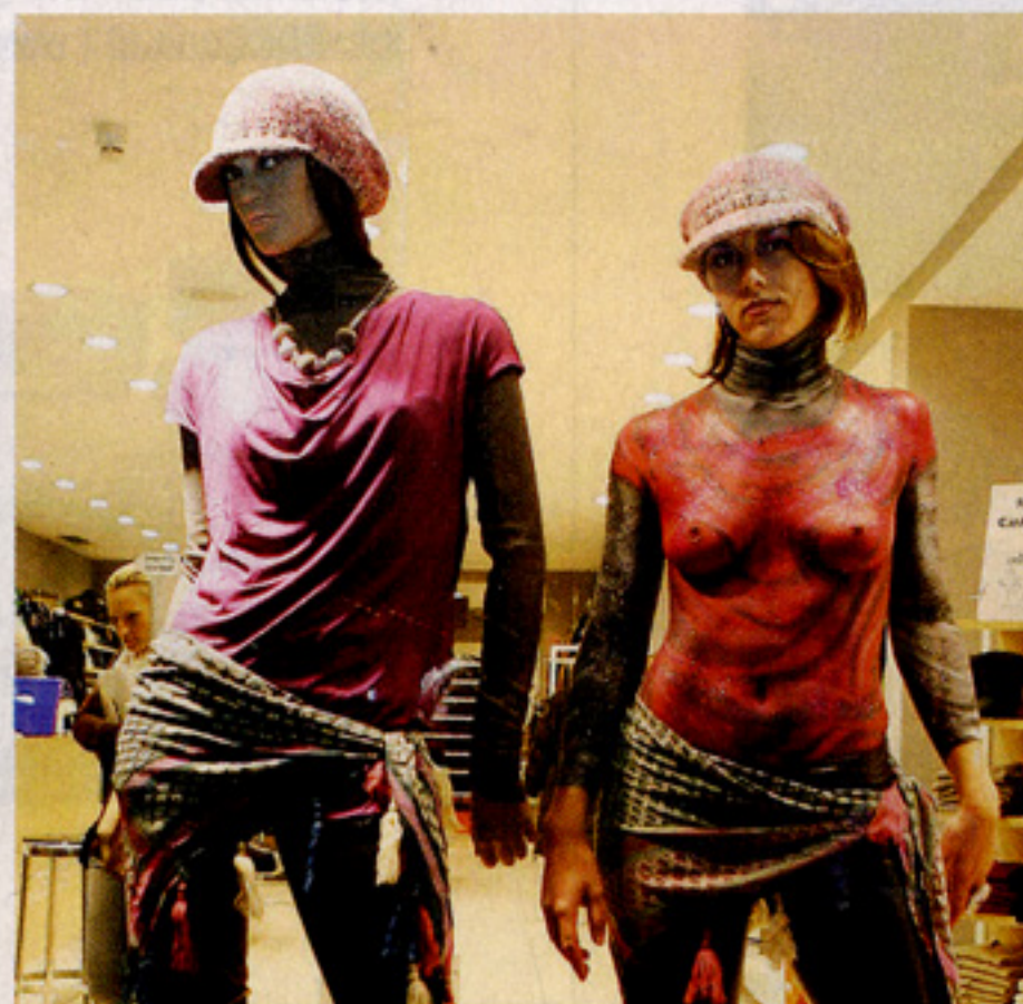
Benetton Schaufensterpuppe und das lebendige Bodypainting-Double.